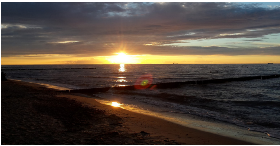
Tramonto sul Mare del Nord