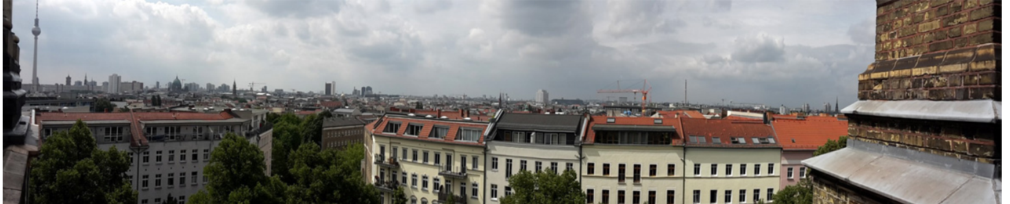
Vista dalla torre della Zionskirche