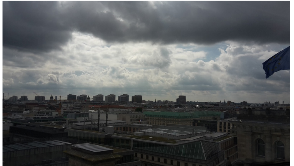
Vista dalla cima del Reichstag