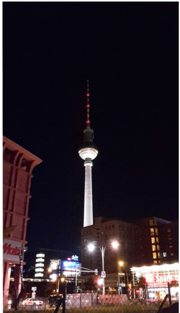
La Torre della televisione, di giorno e di notte